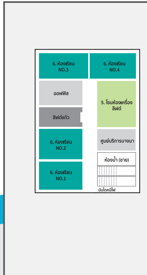
แปลนชั้น 3